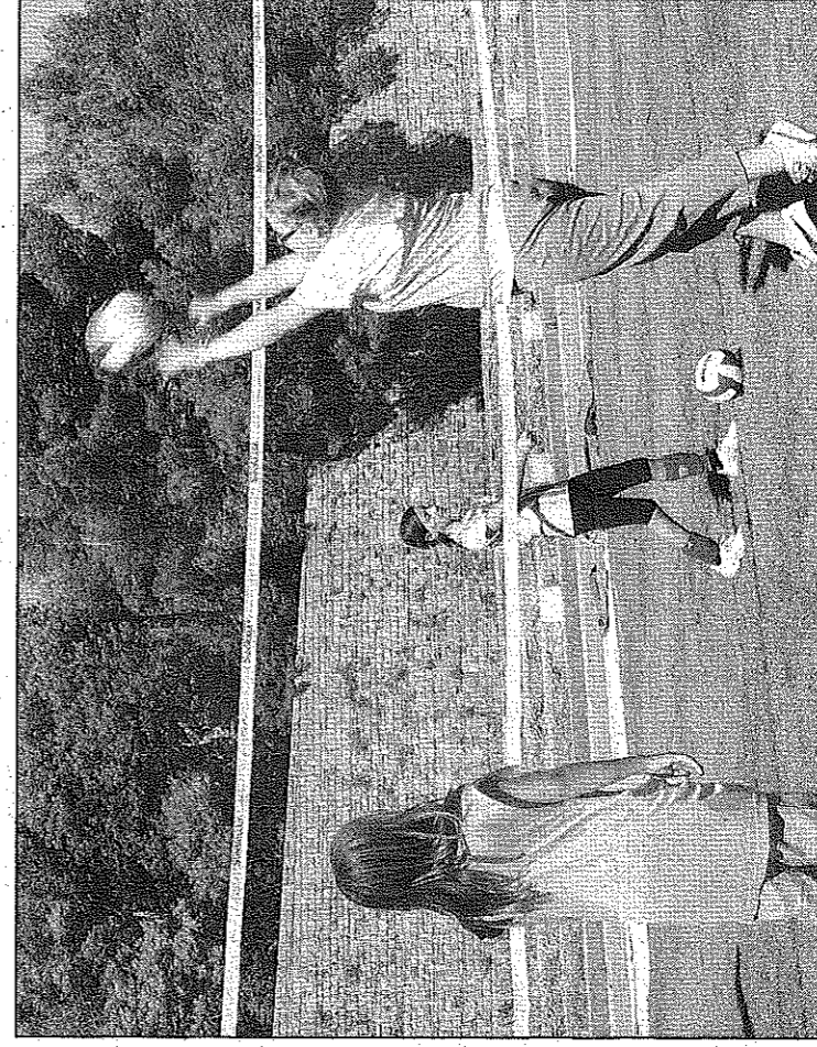
Le volley-ball, discipline peu médiatisée, a moins séduit les jeunes.