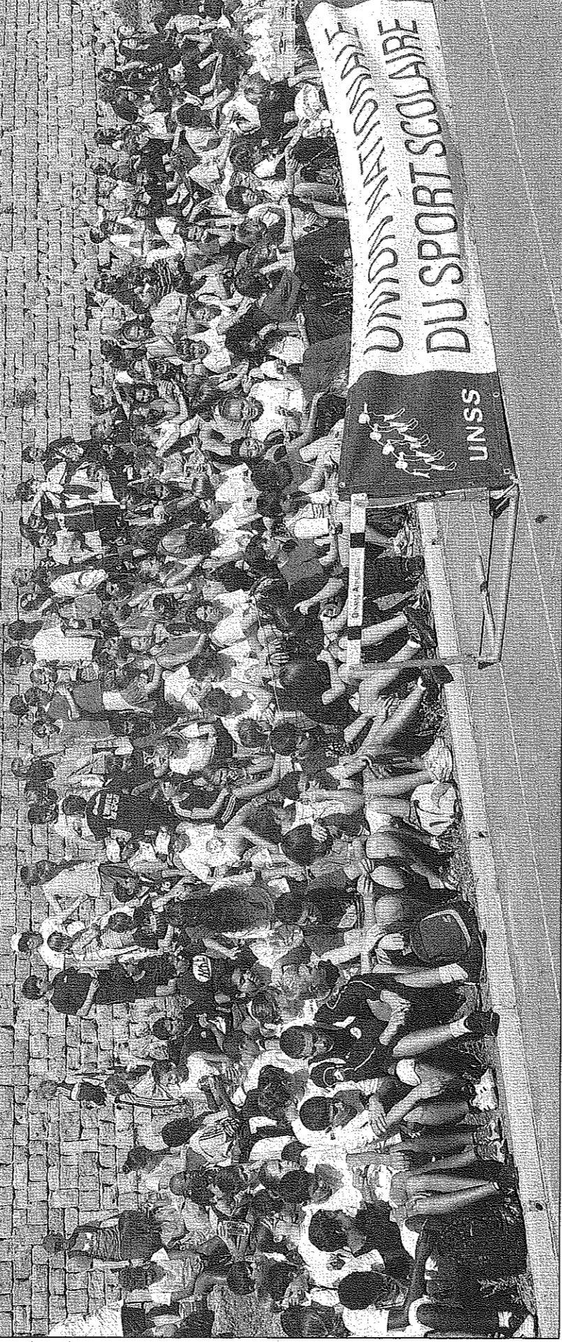
Pres de cinq cents élèves été réunis, hier après-midi, au Creps de Boulouris, pour la deuxième édition de la fête du sport scolaire.

Pres de cinq cents élèves été réunis, hier après-midi, au Creps de Boulouris à l'occasion de la deuxième édition de la fête du sport scolaire. C'est une réforme ministérielle qui a donné naissance à cette manifestation d'envergure nationale. Quatorze collèges du district Union nationale du